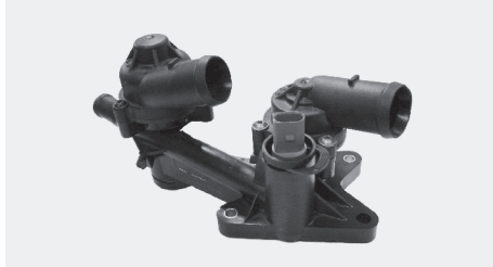
TERMOSTATI SA KUČIŠTEM